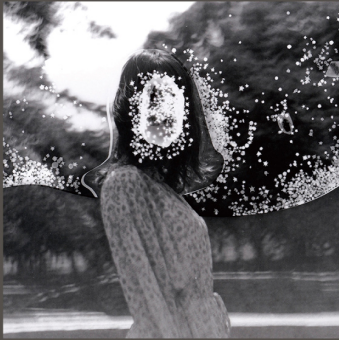
「まなざし」25×25 cm ゼラチンシルバープリント

2019年 清流の国ぎふ芸術祭「第2回ぎふ美術展」 写真部門 入選 2023年 CONTEMPORARY ART COLLECTORS 「Artists Programme 2024」 世界選抜アーティスト13名に選出