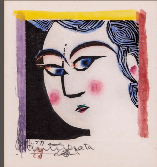
「大顔の柵」27.5×25.8 cm 1959年 板版画