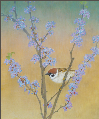
「花蘇芳」8号 絹本着色